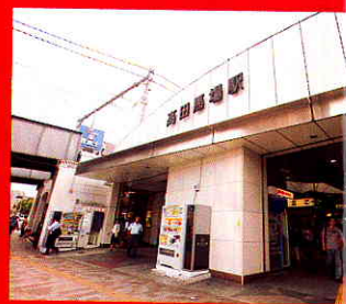
BIG BOX方面に行くときも、「早稲田口」を経由するのが正解。

JRに加え、西武新宿線、東西線も乗り入れている高田馬場駅。先生が言うには「最もパワーの強いのはJR」とか。「高田馬場に来るときは、行きも帰りもJRを使うと許容範囲が広がって、いろんな人とつき合えるようになる運気ももらえるの。なかでも最強パワーが宿っているのが、早稲田口周辺。待ち合わせて数分立っているだけでも、じゅうぶんパワーを吸収できるわ」