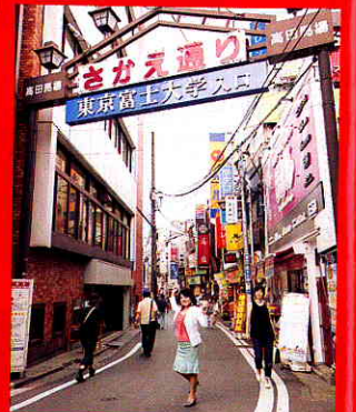
高田馬場の中で最も新宿色が強い場所とか。

「電車が新宿から運んでくる、個性開花のパワーが流れ込んでいる」というのが、駅の早稲田口に面している「さかえ通り」。焼き肉店や居酒屋がひしめく商店街です。「ここでお酒を飲んで食事をすると、芸術方面の才能が伸びたり、手に職をつけることに成功したり、思わぬ特技が見つかったりするはず」